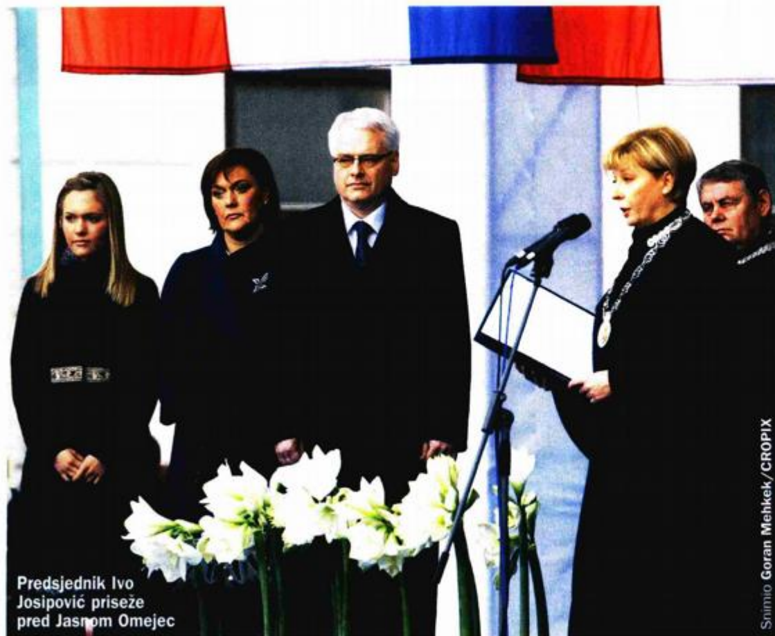
Predsjednik Ivo Josipović priseže pred Jasnom Omejec